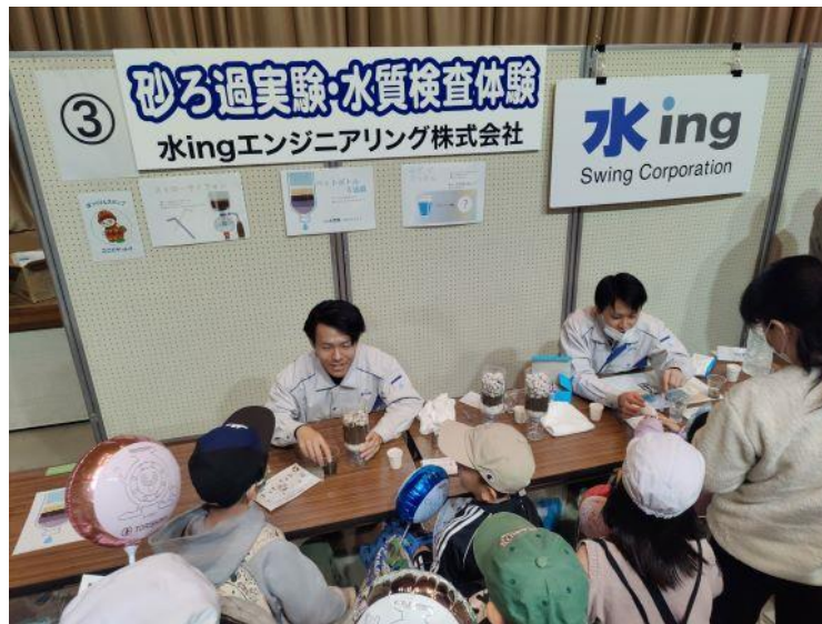
子ども達と楽しんだ「砂ろ過」実験や「水質検査」体験