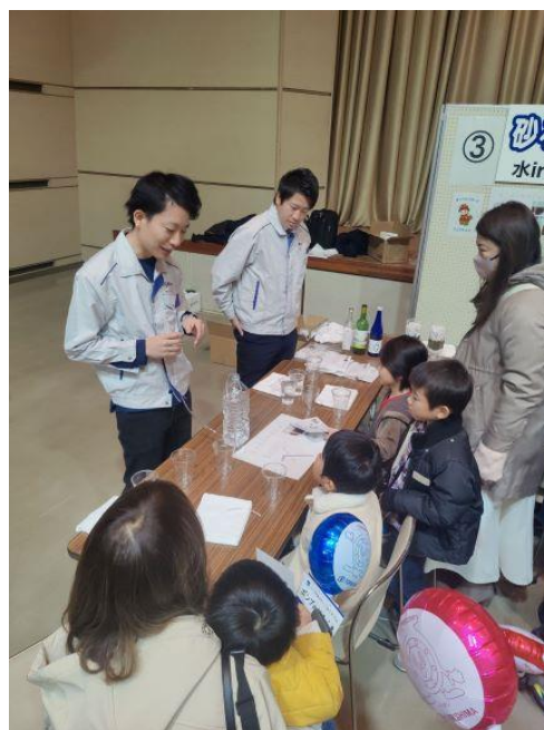
ストローを使ったサイフォンデモにご家族の方も興味津々