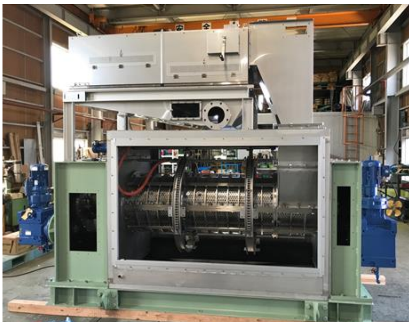
同軸差動式スクレープレス脱水機

水ingグループは、これからも地域の水インフラ持続のために、様々な研究開発や機器・サービスを提供してまいります。